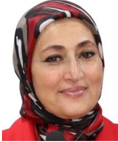
أ.د. ثريا البدوي